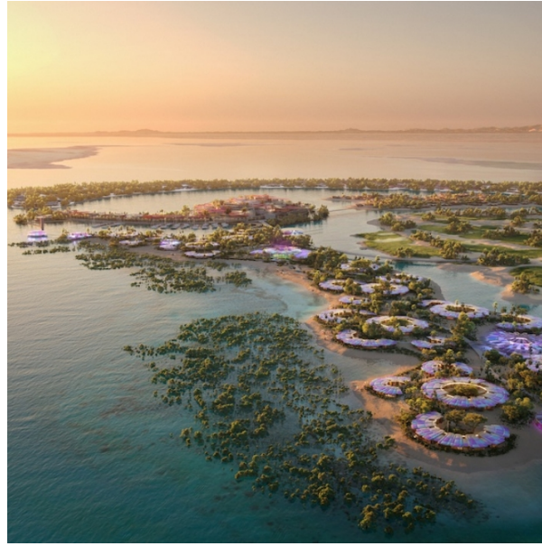
مشروع البحر الأحمر

أخرى على امتداد ساحل البحر الأحمر, يجعل المنطقة في صميم أولويات معظم الخطط التنموية والاستثمارية في المملكة.